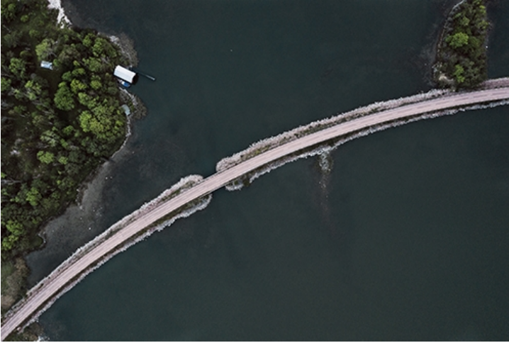
Järsövägen med sina brobankar förbinder många små skärgårdsöar och holmar.