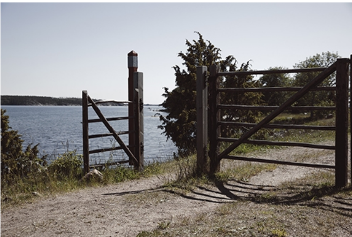
Längs vandringsleden i Bomarsund kan du ta del av Bomarsunds fästnings historia.