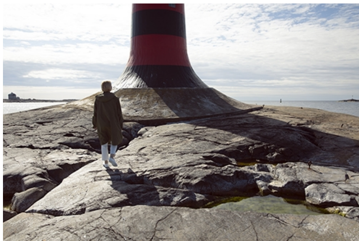
Fyren Marhällan från 1938, längst ut i farleden som leder in mot Mariehamn.