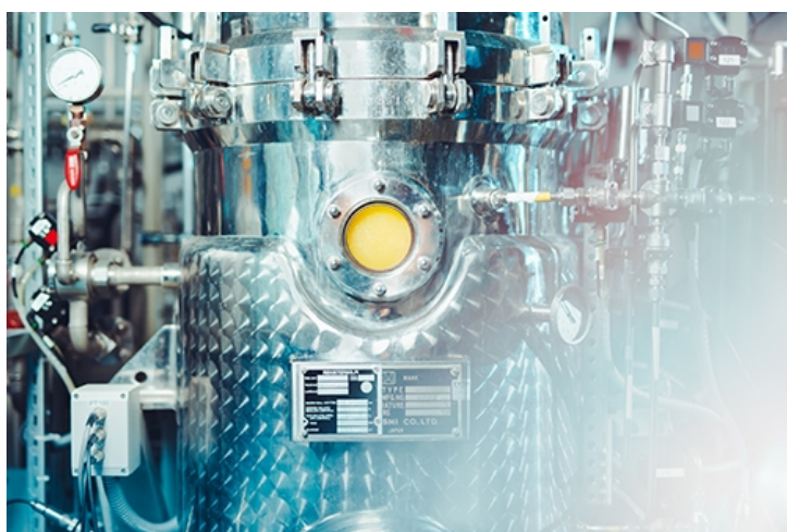
Solein - protein ur luften

- Teamet. För riskkapitalister betyder ett team ofta mer än en produkt. Ett bra team är ett team med människor och kunnande från helt olika områden, såsom till exempel vetenskap, konst och teknik. Dessutom är det svårt att bygga ett tillväxtbolag inom en befintlig bransch, innovations- och tillväxtprocent kan snarare hittas i utkanten av och sömmarna mellan olika branscher.